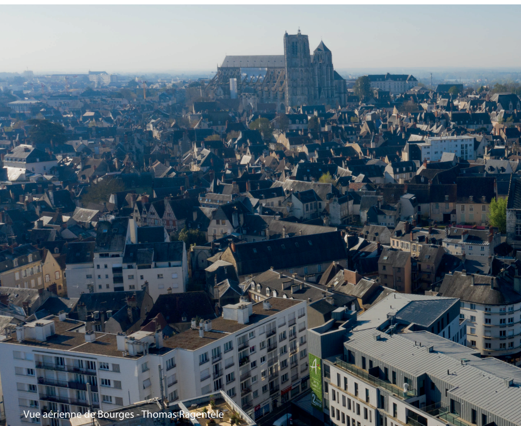
Vue aérienne de Bourges - Thomas Ragentele